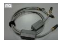
Cavi MIT TERMINATOR 2 € 90,00